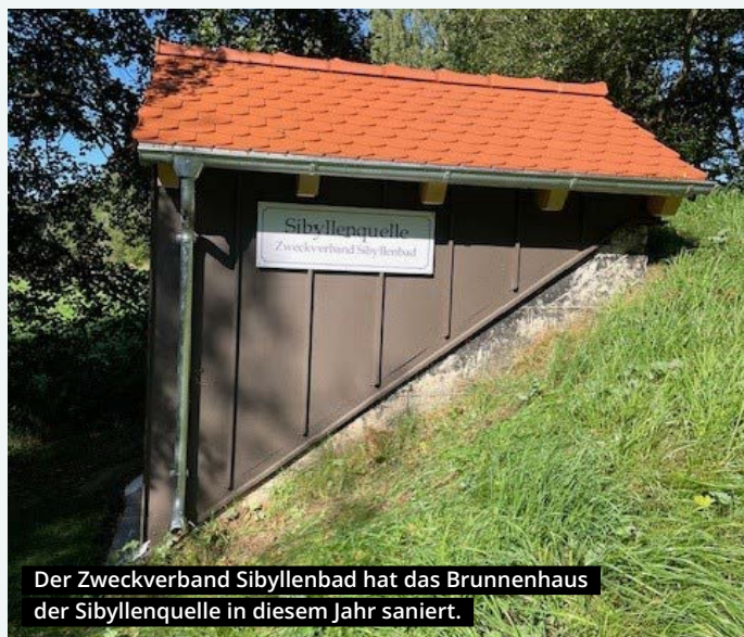
Der Zweckverband Sibyllenbad hat das Brunnenhaus der Sibyllenquelle in diesem Jahr saniert.

Wir freuen uns sehr über die Auszeichnung mit der Silbermedaille beim Wettbewerb „Unser Dorf hat Zukunft“ sowie über den verliehenen Sonderpreis. Diese Ehrungen zeigen, wie viel wir gemeinsam erreichen können, wenn viele Hände anpacken und sich mit Engagement und Herzblut für unsere Gemeinde einsetzen.