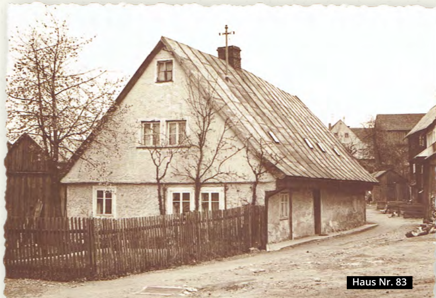
Haus Nr. 83